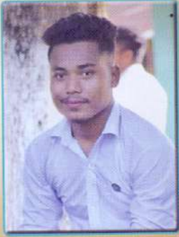
খুৰজ্যোতি খাখলাৰী শ্ৰেষ্ঠ বেডাৰ কাৰাভী