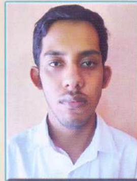
পলাশ প্ৰতীম আদিত্য শ্ৰেষ্ঠ সমাজসেৱক