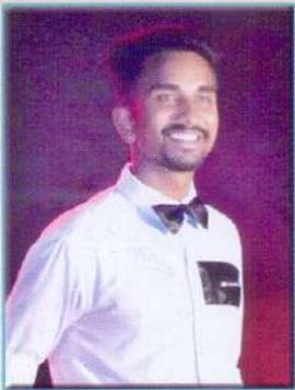
প্ৰযোজ্য মাধৱ দত্ত মিষ্টাৰ সোণাৰি কলেজ