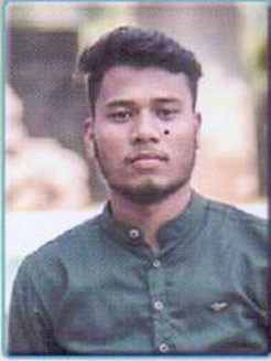
সীমান্ত হাজৰিকা সভাপতি