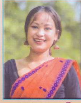
বৰষা ৰাজকুমাৰী শ্ৰেষ্ঠা অভিনেত্ৰী