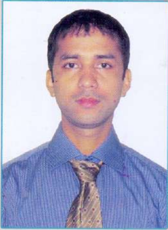
ড° পৰানন কোঁৱৰ উপদেষ্টা