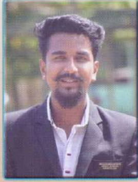
প্ৰযোজ্য মাধৱ দত্ত শ্ৰেষ্ঠ অভিনেতা