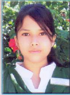
প্ৰগামী বৈশ্য উপ-সভানেত্ৰী