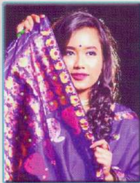
লোপামুদ্ৰা মহন মিচ সোণাৰি কলেজ