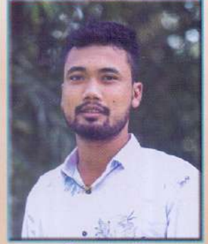
সঞ্জীৱ শইকীয়া শ্ৰেষ্ঠ সহ অভিনেতা