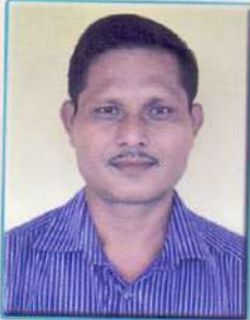
বাণা কোঁৱৰ মূৰব্বী