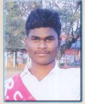
নিতুল মানকী মিষ্টাৰ সোণাৰি কলেজ