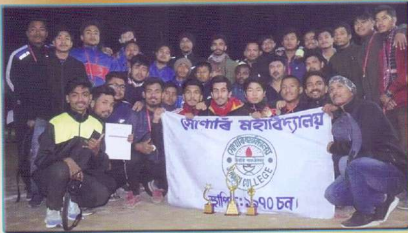
মহাবিদ্যালয়ৰ শ্ৰেষ্ঠ কাৰাভী দল

“ সাঁচিপাতে ভাষা দিব চিফুঙে আশা দিব বংশৰে মেলিব দুৱাৰ... ”