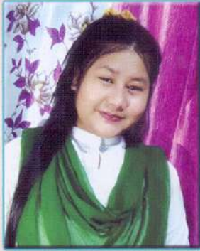
আইভী ৰাজকুমাৰী শ্ৰেষ্ঠা সহ অভিনেত্ৰী