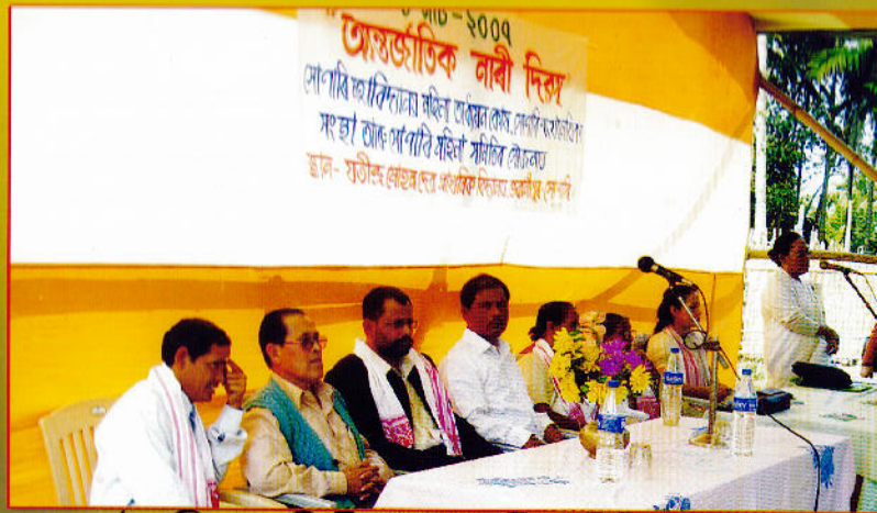
আন্তর্জাতিক নারী দিবসে উপস্থিত বিশিষ্ট ব্যক্তিসকল